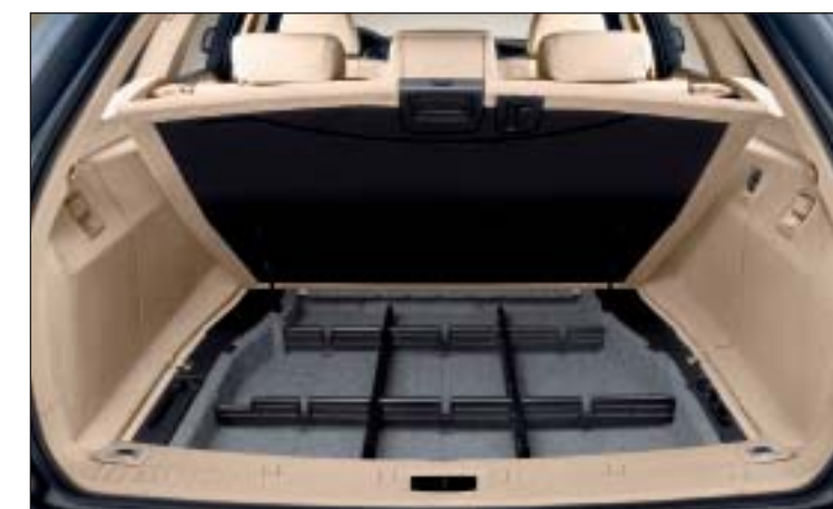
Il vano portaoggetti con serratura può essere variamente utilizzato grazie ai quattro elementi suddivisori spostabili.

Il bagagliaio è studiato in modo da poter essere «configurato» individualmente.