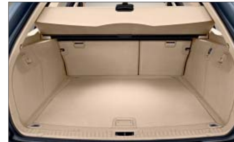
La copertura avvolgibile si solleva automaticamente quando si apre il portellone o il lunotto.